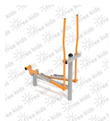
Fot.5 Przykładowe zdjęcie

2 Elementy kotwiące powinny być zabetonowane w fundamentach o wymiarach 0,5 x 0,5 x 0,6 m