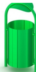
Fot.12 Przykładowe zdjęcie

Kotwienie – urządzenie na stałe posadowione w gruncie, betonowane betonem klasy min. B-15.