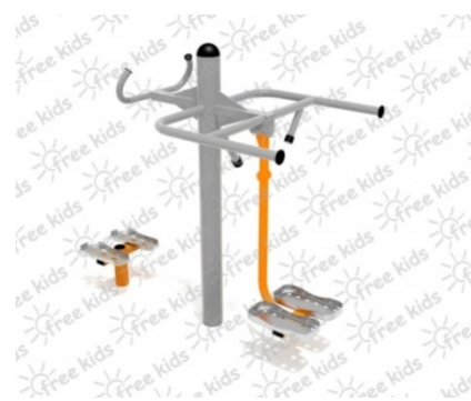
Fot.4 Przykładowe zdjęcie

2 Elementy kotwiące powinny być zabetonowane w fundamentach o wymiarach 0,5 x 0,5 x 0,6 m