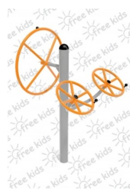
Fot.6 Przykładowe zdjęcie

Konstrukcja nośna oraz pozostałe elementy wykonane z rur stalowych ocynkowanych i malowanych proszkowo. Stopnice wykonane z blachy stalowej ocynkowanej i malowanej proszkowo. Nakrętki kołpakowe ocynkowane zabezpieczone przed odkręceniem, łożyska zamknięte bezobsługowe. Urządzenie powinno być wyposażone w amortyzatory gumowe tłumiące uderzenia. Urządzenie na stałe posadowione w gruncie, betonowane betonem klasy min. B-15.