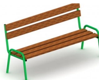
Fot.11 Przykładowe zdjęcie

Elementy stalowe ocynkowane i malowane proszkowo. Drewno - Elementy drewniane lite malowane drewnochronem;