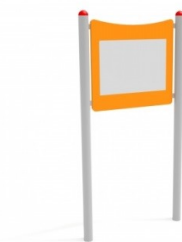
Fot.14 Przykładowe zdjęcie

Kotwienie –urządzenie na stałe posadowione w gruncie, betonowane betonem klasy min. B-15.