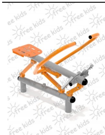
Fot.2 Przykładowe zdjęcie

Konstrukcja nośna oraz pozostałe elementy wykonane z rur stalowych ocynkowanych i malowanych proszkowo. Stopnice wykonane z blachy stalowej ocynkowanej i malowanej proszkowo. Nakrętki kołpakowe ocynkowane zabezpieczone przed odkręceniem, łożyska zamknięte bezobsługowe. Urządzenie powinno być wyposażone w amortyzatory gumowe tłumiące uderzenia. Urządzenie na stałe posadowione w gruncie, betonowane betonem klasy min. B-15.