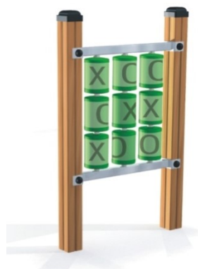
Fot.10 Przykładowe zdjęcie

Dodatki – belki konstrukcyjne osłonięte kapturkami z tworzywa sztucznego. Łby śrub, nakrętki osłonięte plastikowymi zaślepkami. Nakrętki kołpakowe z łbem kulistym.