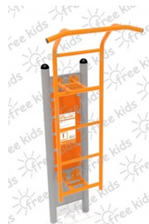
Fot.3 Przykładowe zdjęcie

Elementy kotwiące powinny być zabetonowane w fundamencie o wymiarach 1,0 x 0,5 x 0,6 m