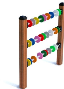
Fot.7 Przykładowe zdjęcie

Dodatki – belki konstrukcyjne osłonięte kapturkami z tworzywa sztucznego. Łby śrub, nakrętki osłonięte plastikowymi zaślepkami. Nakrętki kołpakowe z łbem kulistym.