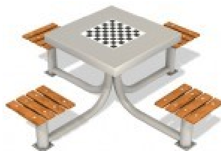
Fot.8 Przykładowe zdjęcie

Zalecana nawierzchnia: zgodnie z normą 1176-1:2009