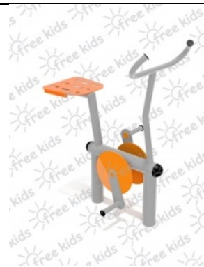
Fot.1 Przykładowe zdjęcie

Konstrukcja nośna oraz pozostałe elementy wykonane z rur stalowych ocynkowanych i malowanych proszkowo. Stopnice wykonane z blachy stalowej ocynkowanej i malowanej proszkowo. Nakrętki kołpakowe ocynkowane zabezpieczone przed odkręceniem, łożyska zamknięte bezobsługowe. Urządzenie powinno być wyposażone w amortyzatory gumowe tłumiące uderzenia.