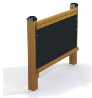
Fot.9 Przykładowe zdjęcie

Zalecana nawierzchnia: zgodnie z normą 1176-1:2009